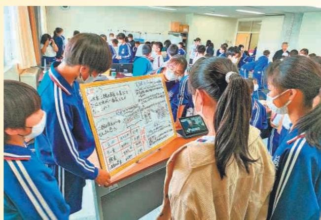
研究の成果を発表する6年生