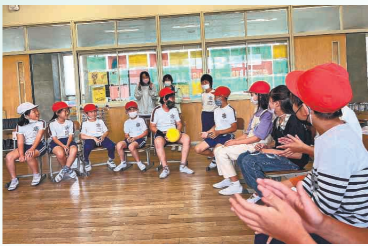
絆を深める「にこにこ班活動」