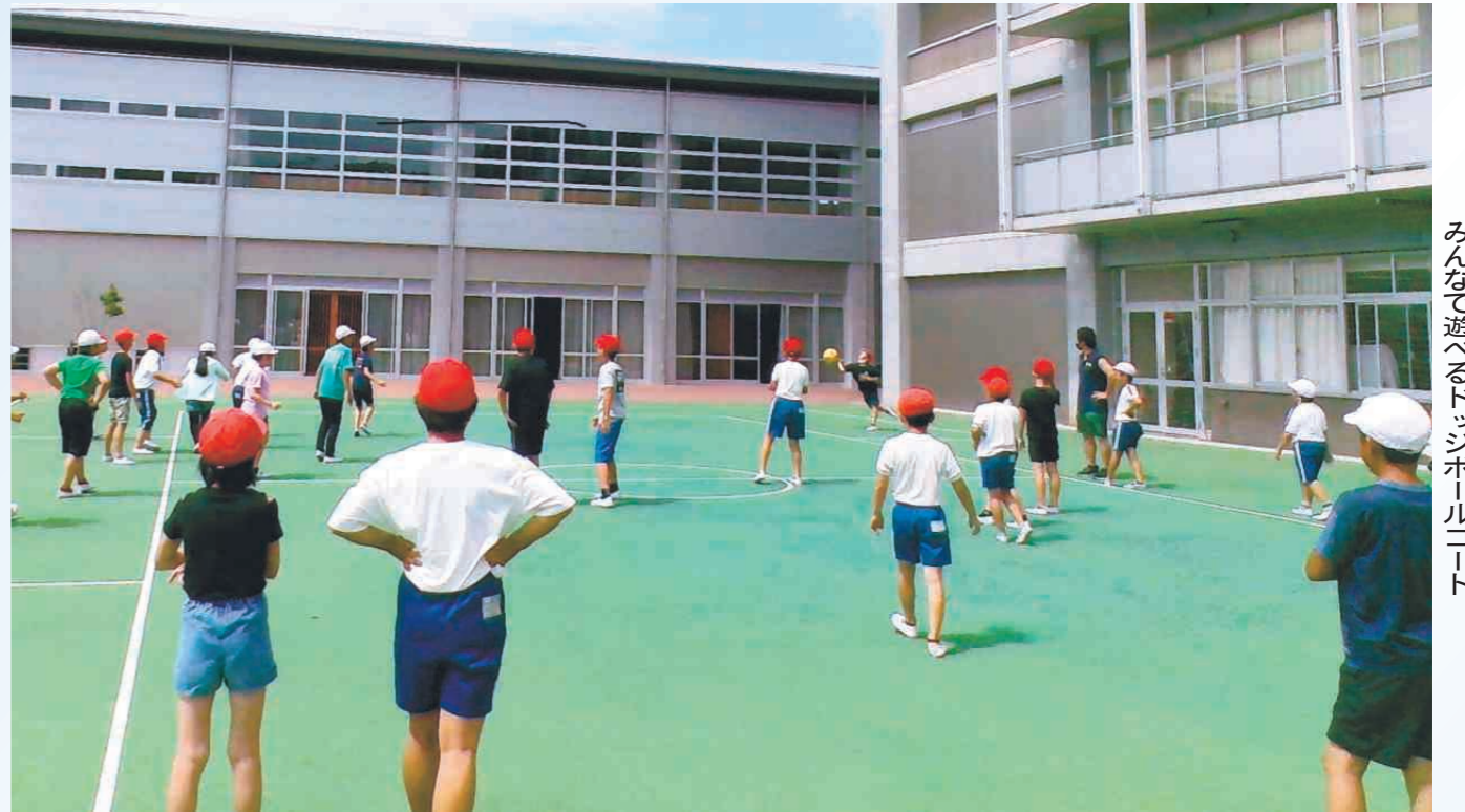
みんな遊ぶドッジボールコート