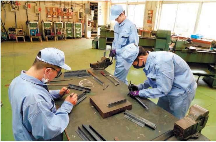
実習をするメカニカルテクノ系列の生徒たち