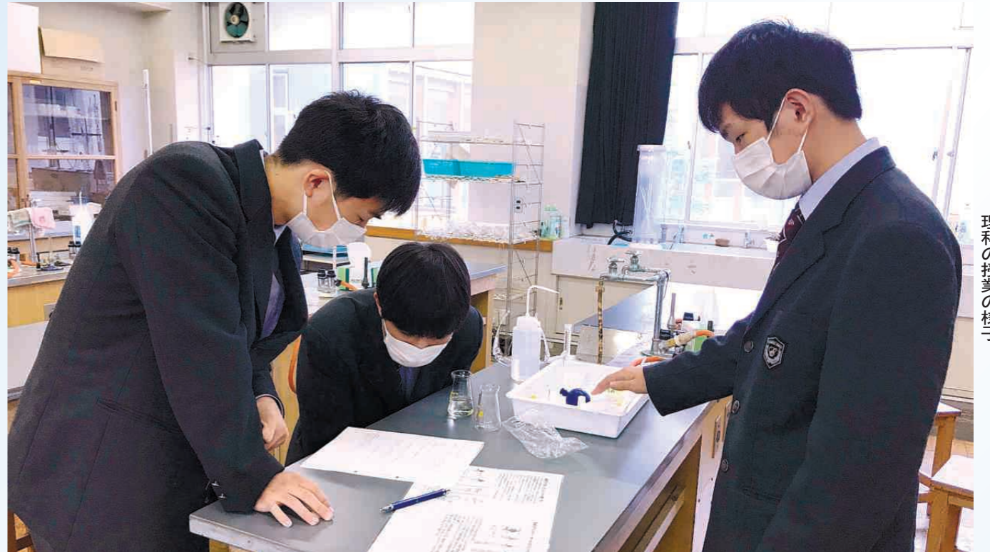
理科の授業の様子