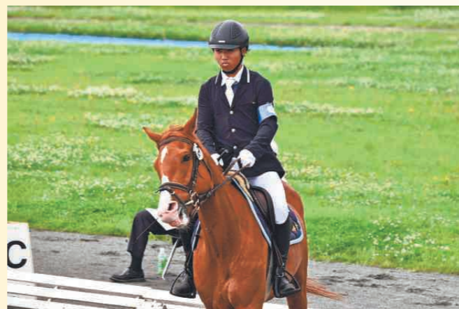
馬術部の活動の様子