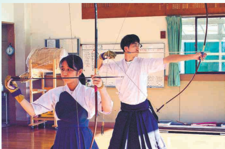
関東大会に出場した弓道部の練習