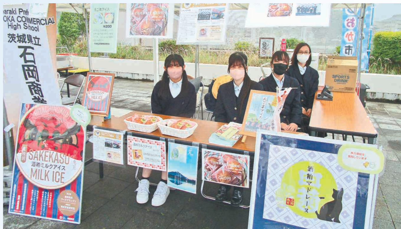
地域のイベントでの販売実習の様子