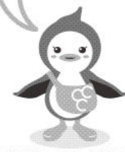
茨城新聞キャラクター「ひばらん」