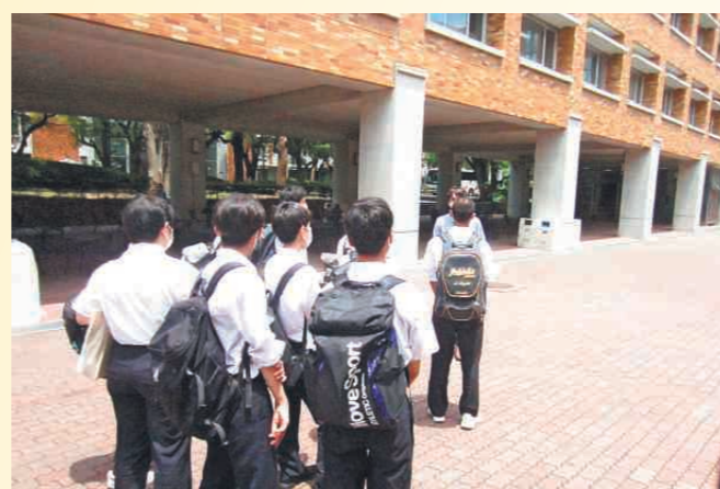
進路別のバス研修(けんしゅう)会