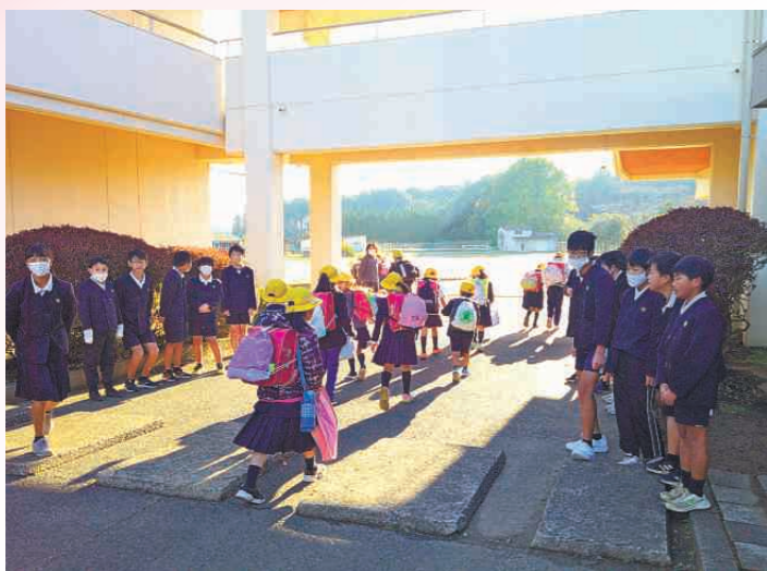
正午のランニング