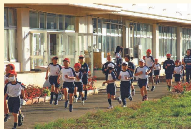
みんなで体力アップ