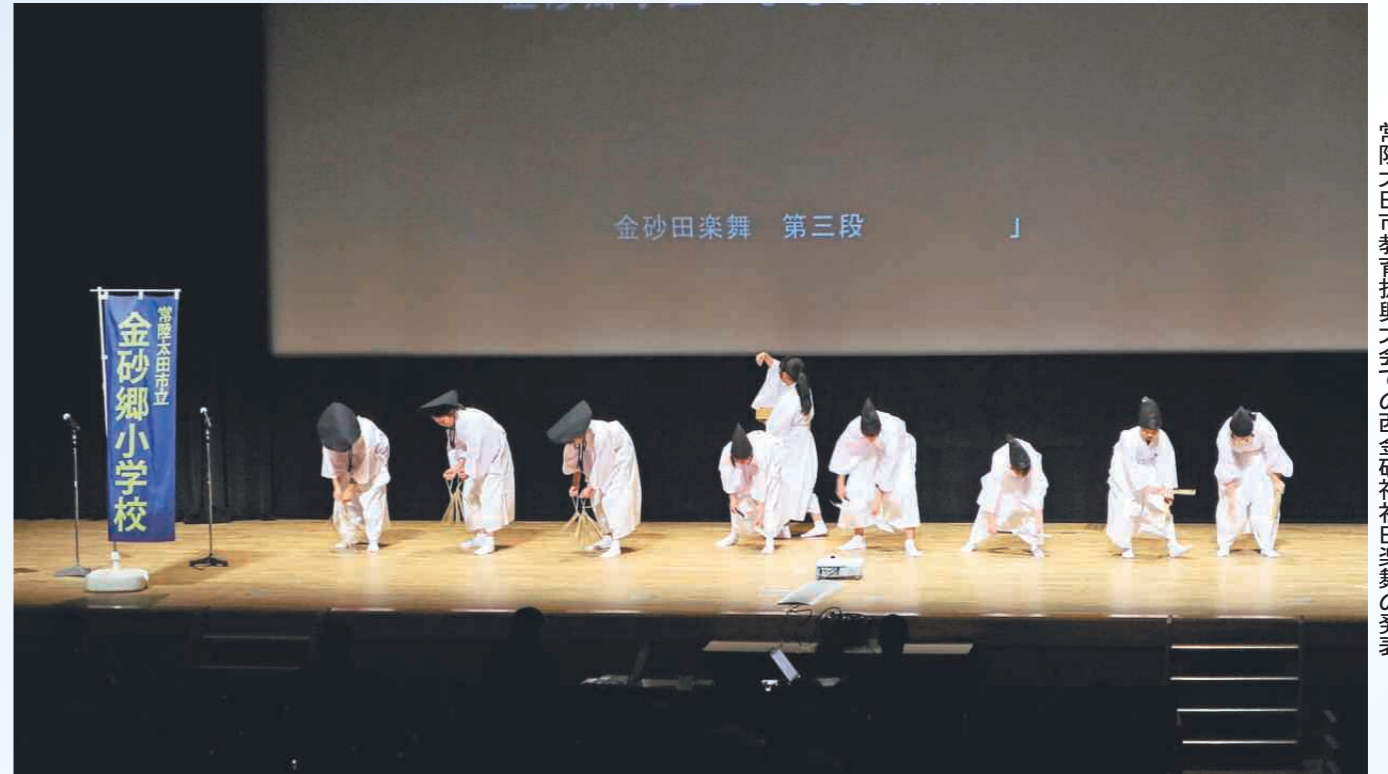
常陸太田市教育振興大会での西金砂神社田楽舞の発表