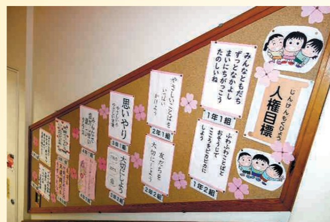
学級で話し合った人権目標コーナー