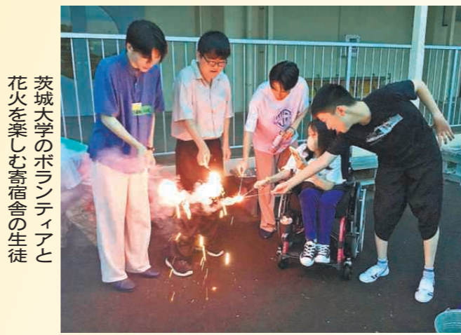
茨城大学のボランティアと花火を楽しむ寄宿舎の生徒