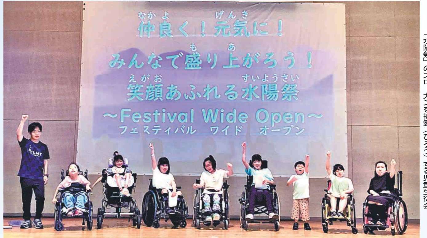
「水陽祭」のスローガンを披露(ひら)く児童生徒会