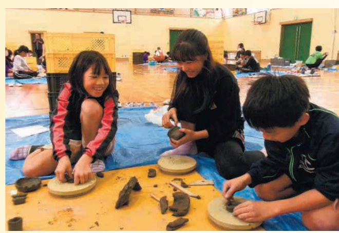
自分たちが練った粘土で作陶活動