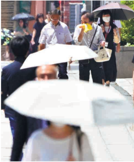
県内では今夏、厳しい暑さが続き、街中では日傘を差したり汗を拭いたりする人が見られた。7月22日、水戸市南町