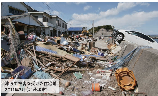
津波で被害を受けた住宅地 2011年3月(北茨城市)