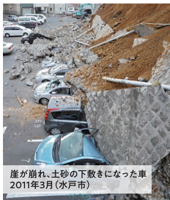
崖が崩れ、土砂の下敷きになった車 2011年3月(水戸市)