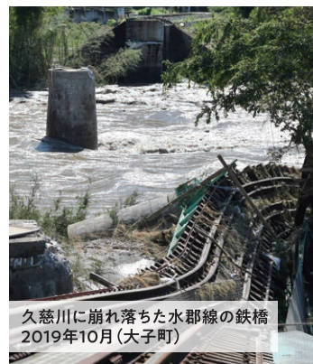
久慈川に崩れ落ちた水郡線の鉄橋 2019年10月(大子町)