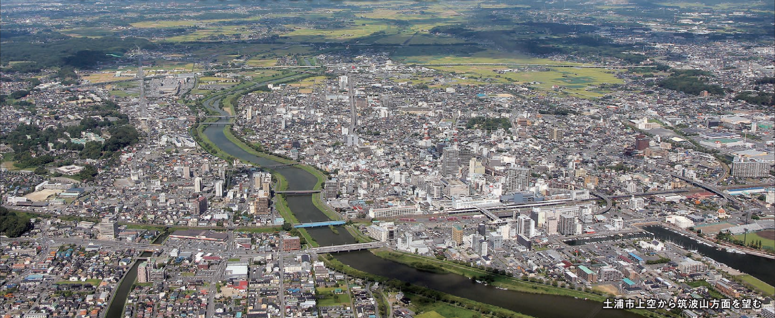
土浦市上空から筑波山方面を望む